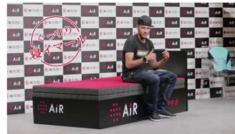
記者会見フォトセッションシーン