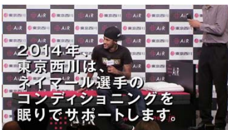
マットレスに座りながら コメントをしている様子の ネイマール