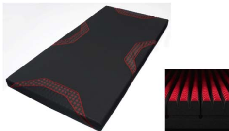
[エアールSI] マットレス ¥76,000円+税～

アスリートの遠征、ビジネスマンの出張など、外泊時のホテルなどで快適な眠りを提供します。