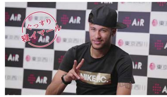
Na(ネイマールボイス): 「ぐっすり寝イマール」