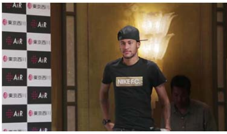
記者会見会場に登場する ネイマール