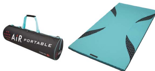
[エアールポータブル] モバイルマット ¥32,000+税